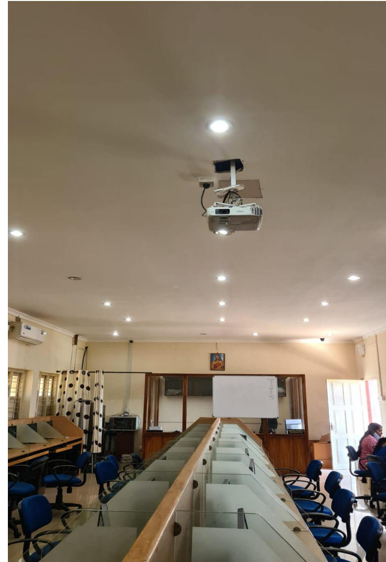
Sensor based power conservation