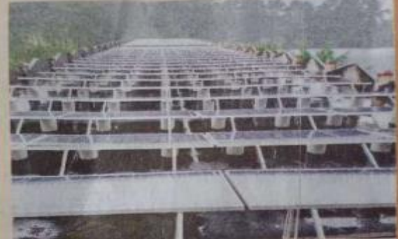
പഴശ്ശിരാജ കോളേജിൽ പ്രവർത്തനസജ്ജമായ സോളാർ പ്ലാന്റ്

കൽപ്പി സൗര പുരസ്കൃത സൗരോർജ പദ്ധതിയിൽ ഉൾപ്പെടുത്തി പൂർണ്ണമായി പഴശ്ശിരാജ കോളേജിൽ സ്ഥാപിച്ച സോളാർ പ്ലാന്റ് പ്രവർത്തന സജ്ജം. തിങ്കളാഴ്ച പ്ലാന്റ് ഉദ്ഘാടനം ചെയ്തപ്പോൾ 75 കിലോവാട്ട് പീക്ക് പവർ ശേഷിയുള്ള ഓൺഗ്രിഡ് സോളാർ പ്ലാന്റാണ് നിർമ്മിച്ചത്. കെഎസ്ഇസി അനുവദിച്ച 40 ലക്ഷം രൂപ ചെലവിലാണ് നിർമ്മാണം. 25 വർഷത്തേക്കുള്ള പരിപാലനം കെഎസ്ഇസിയാണ്. പ്ലാന്റിൽനിന്ന് പ്രതിവർഷം ഒരു ലക്ഷത്തി എണ്ണായിരം യൂണിറ്റ് വൈദ്യുതി ഉൽപ്പാദിപ്പിക്കാം. കോഴിക്കോട് സൗര പ്രോജക്ട് മാനേജ്മെന്റ് നോർമൽസൗകര്യങ്ങൾ ഡിവിഷനാണ് പദ്ധതിയുടെ നിർവഹണ ചുമതല. 2020 പവർ സോളാർ കമ്പനിയാണ് പ്ലാന്റ് നിർമ്മിച്ചത്. ബന്ധത്തിൽ താല്പരതയുള്ളവർക്ക് വിവരങ്ങൾ 664 യൂണിറ്റ് വൈദ്യുതി ഉൽപ്പാദിപ്പിക്കുന്ന 165 കിലോവാട്ടിന്റെ പദ്ധതി ഉടൻ തുടങ്ങും. കെഎസ്ഇസിയിലുമായി കരാറായി. 90 ലക്ഷം രൂപയുടെ പദ്ധതിയാണ്. ജില്ലയിലെ സർക്കാർ സ്ഥാപനങ്ങൾ, മിക്ക ഗവണ്മെന്റുകൾ സ്കൂളുകൾ, പോലീസ് സ്റ്റേഷനുകൾ എന്നിവയെല്ലാം സൗരോർജ്ജ സോളാർ പദ്ധതികളായി കെഎസ്ഇസിയിലുമായി ധാരണാപത്രം ഒപ്പുവച്ചിട്ടുണ്ട്. ജില്ലയിൽ നാല് മെഗാവാട്ട് ഉൽപ്പാദനമാണ് ലക്ഷ്യം. സർക്കാർ സ്ഥാപനങ്ങൾ പുരസ്കൃത സോളാർ പദ്ധതി തുടങ്ങും.