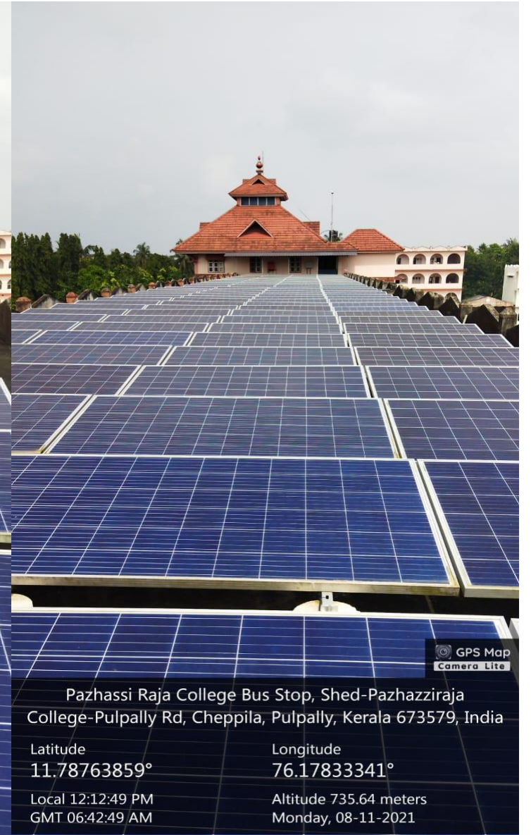
Pazhassi Raja College Bus Stop, Shed-Pazhazziraja College-Pulpally Rd, Cheppila, Pulpally, Kerala 673579, India