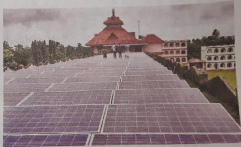
Setting a trend: The roof-top solar panels installed at Pazhassiraja College at Pulpally in Wayanad district.

The Kerala State Electricity Board (KSEB) is commissioning a roof-top solar power plant atop Pazhassiraja College at Pulpally. Wayanad District Collector Adeela Abudulla will inaugurate it at 11 a.m. on Monday.