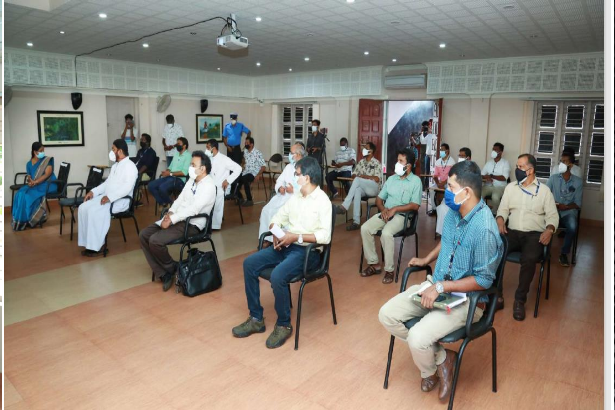
Energy Conservation & Alternate Sources of Energy