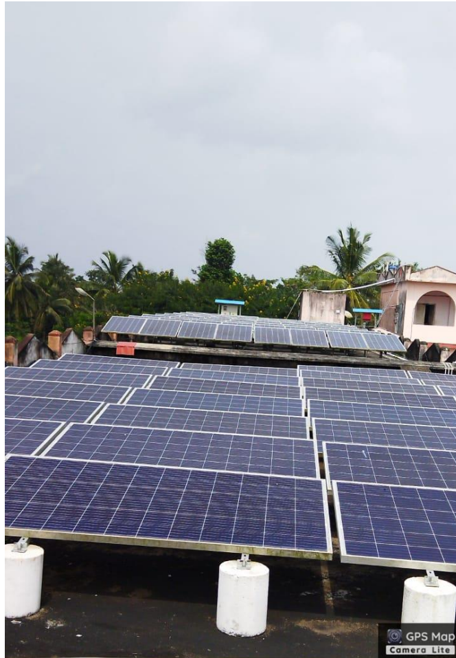
Shed-Pazhassiraja College, Pulpally - Sultan Bathery Hwy, Cheppila, Pulpally, Kerala 673579, India